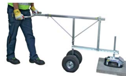
FXAH-120-GRABO-GREENLINE con set ruote VPH-RS e FXAH-120-DUO-Set

Posa le lastre ancora più facilmente con il kit ruote per una posa ancora più veloce ed efficiente.